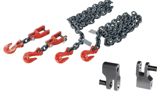
チェーンセット KSV-13 チェーンアダプター