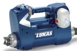
改良されたクラウ形状