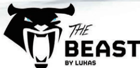
S788E2 スーパーカッター